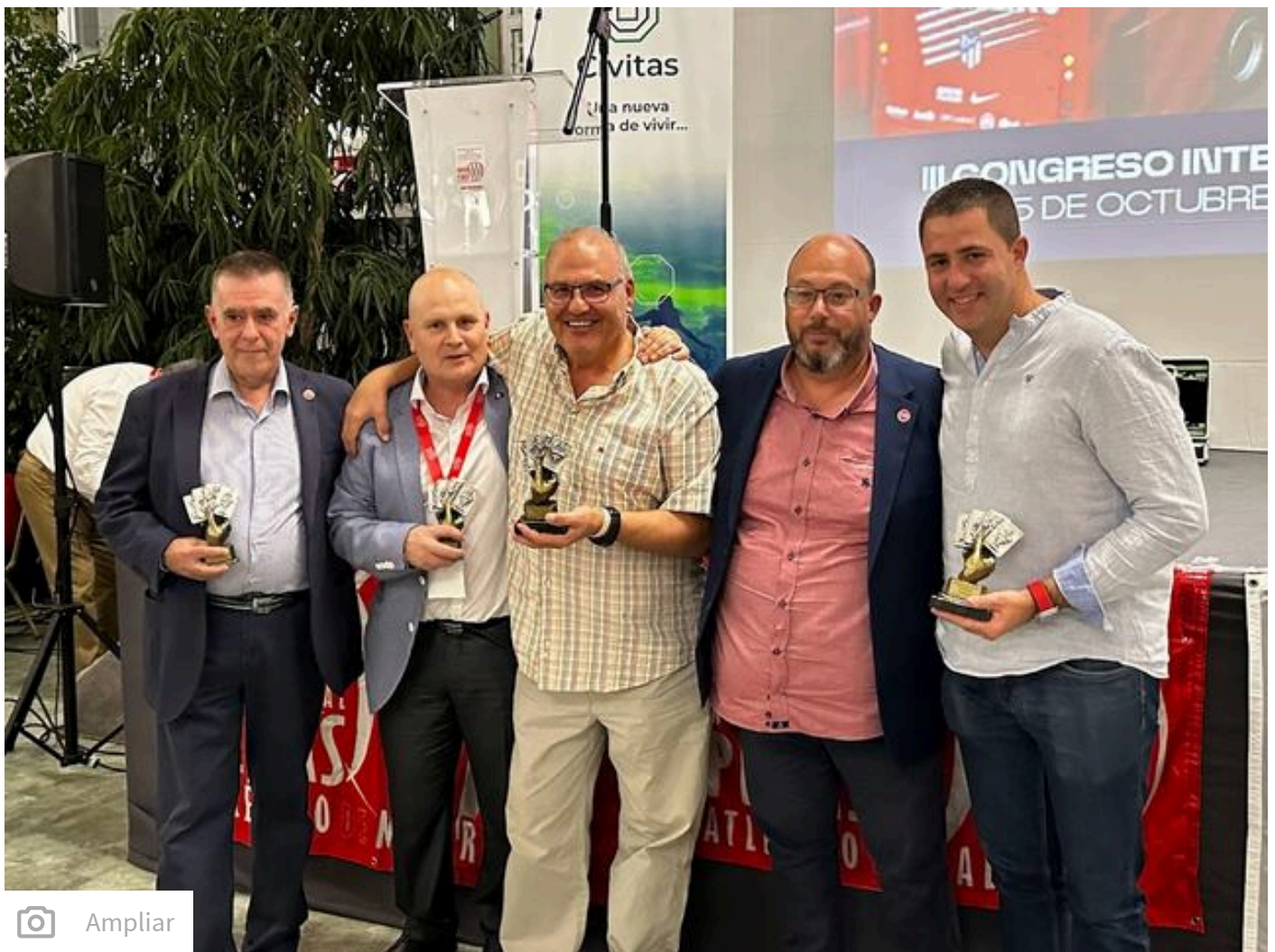
Los periodistas, durante el coloquio.