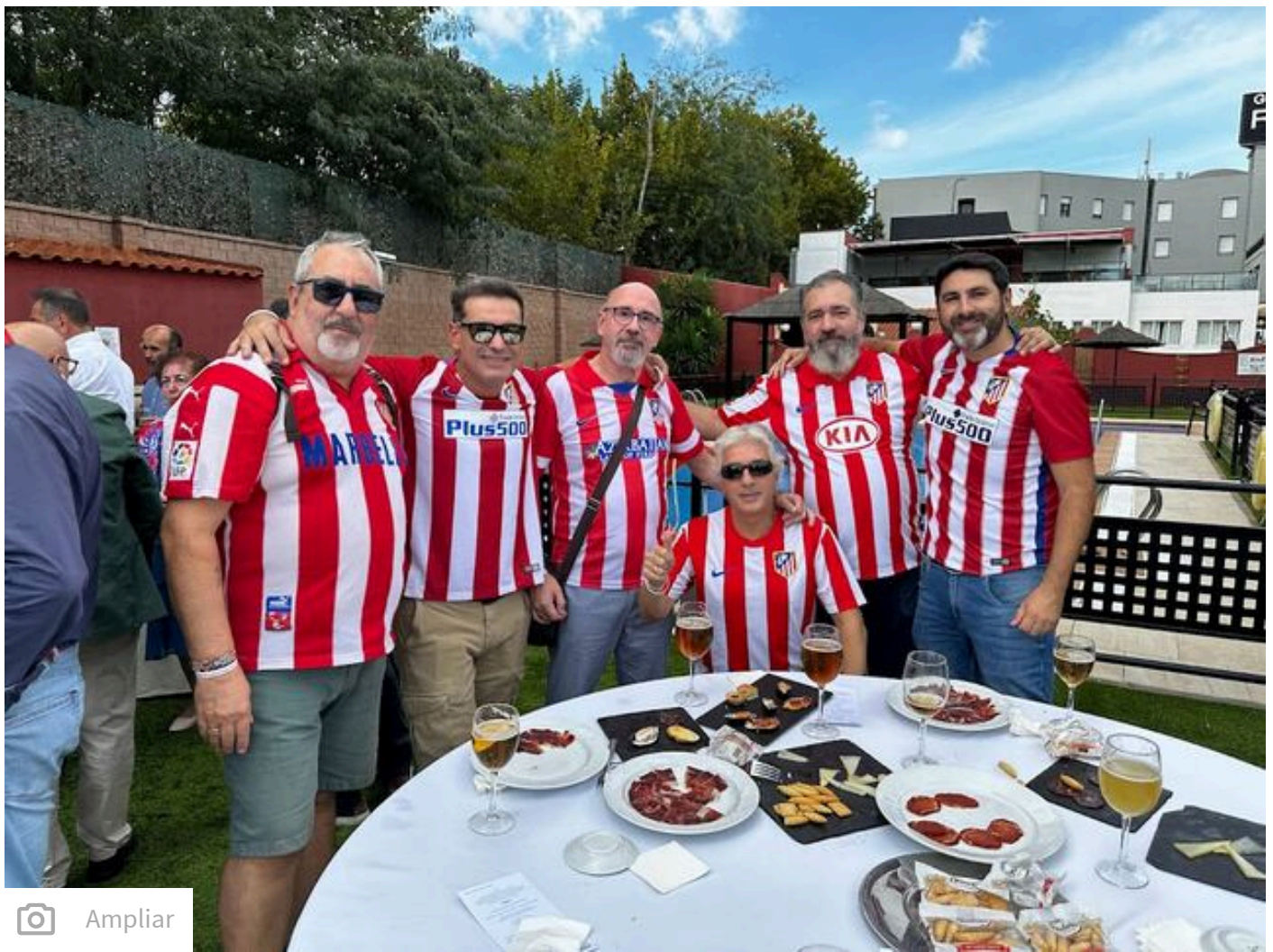
Peñistas, en la jornada del sábado.