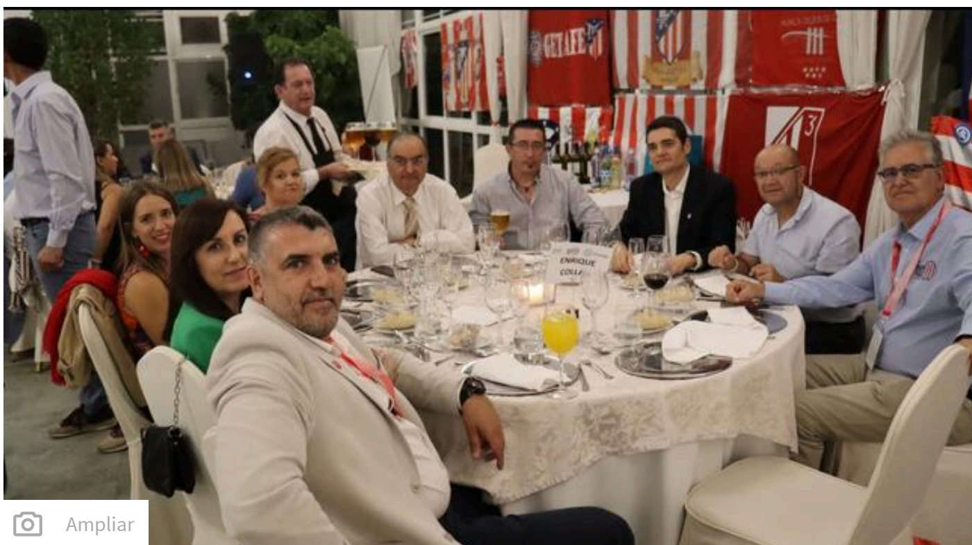
Cena del sábado en el Hotel Río.